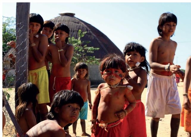
Araguaia amb el bisbe Casaldàliga - Carta nº 84 - Pàg. 3

En resposta a l'últim pla d'invasió, 130 xavantes van acampar durant una setmana a la cruïlla dins de la terra indígena, que era l'antiga Posto da Mata, que va ser completament destruïda en una nova intrusió ruralista el 2014.